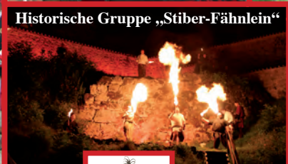
Historische Gruppe „Stiber-Fähnlein“