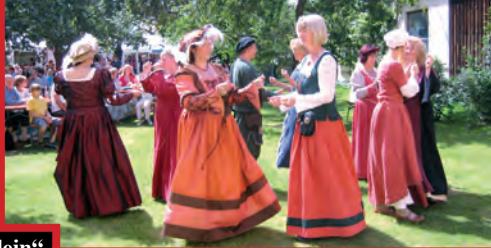
Historische Gruppe „Stiber-Fähnlein“